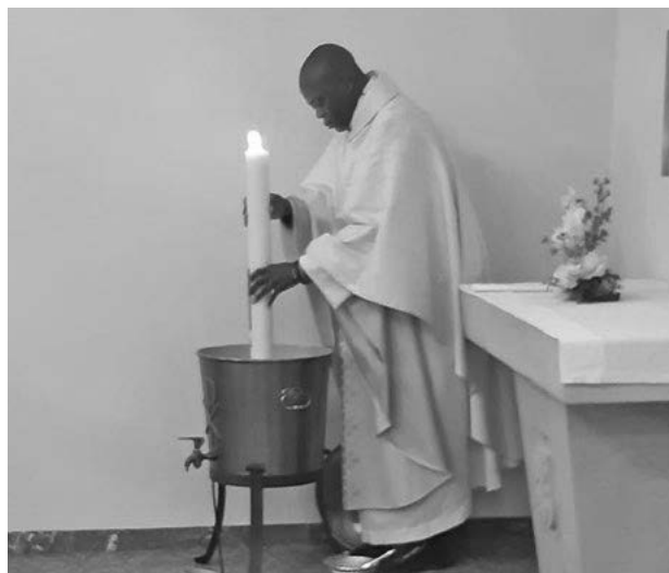
Pâques à Oberbruck