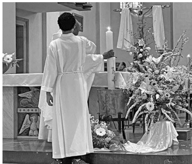
Pâques à Masevaux