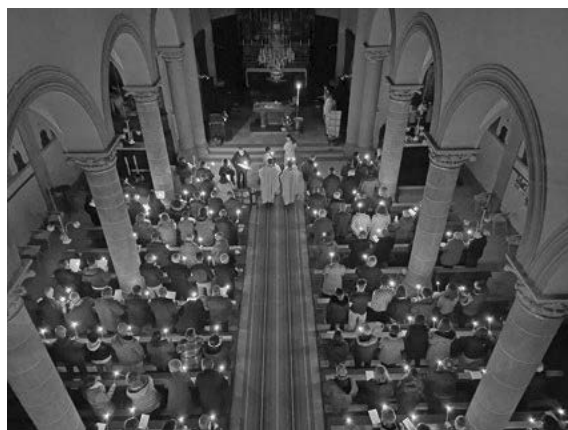
Vigile Pascale à Rimbach

Le Jeudi saint l'Eglise célèbre l'institution de l'Eucharistie et le ministère des prêtres. C'est en l'église de Masevaux que l'ensemble de la communauté