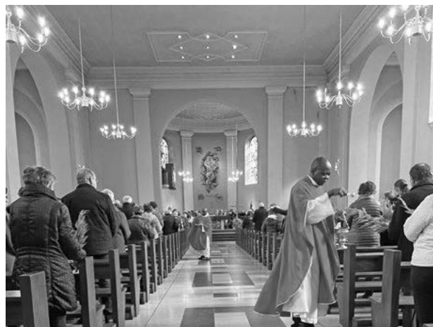
Rameaux à Masevaux

Le dimanche de Pâques nous avons fêté la Résurrection.